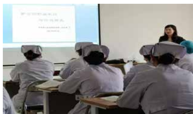
■ 护士礼仪知识授课