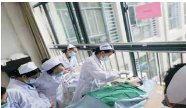
■ 留置胃管操作技术培训