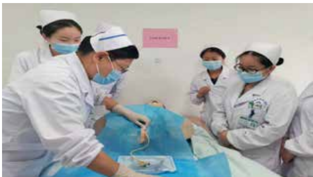
■ 女性留置导尿管操作培训