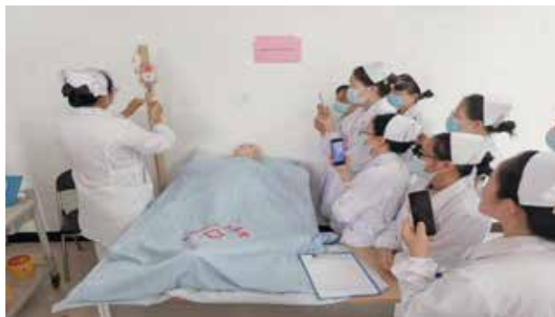
■ 静脉血标本采集与静脉输血操作培训