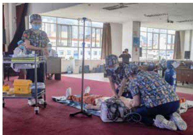
■ 儿科新生儿室参赛队