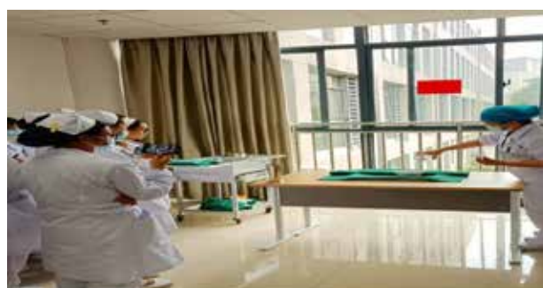
■ 无菌技术操作培训