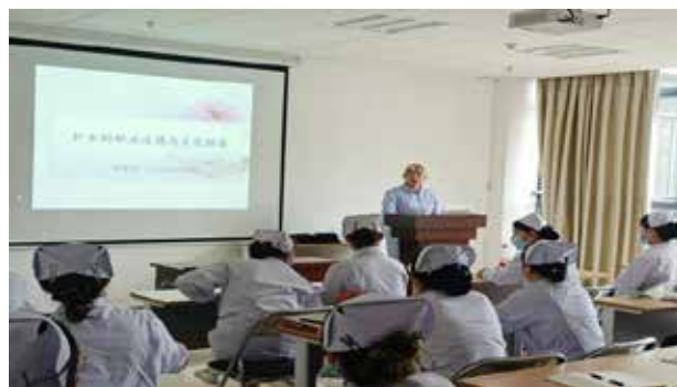
■ 护士的职业道德与文化修养知识授课