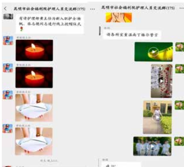
■ 新入职护理人员授帽