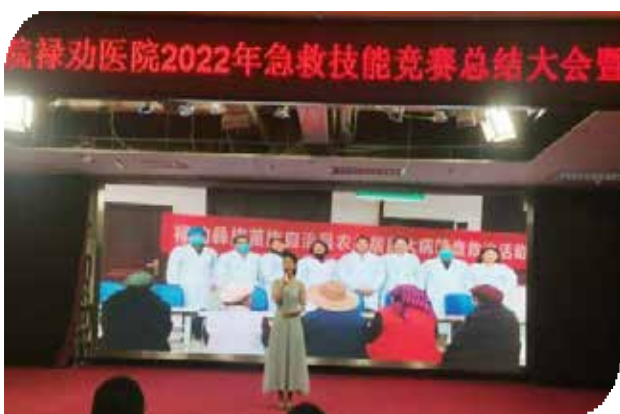
■ 健康扶贫个人演讲