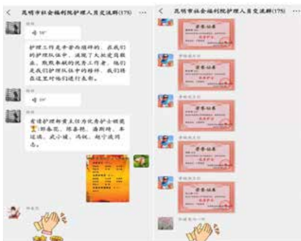
■ 优秀护理人员表彰