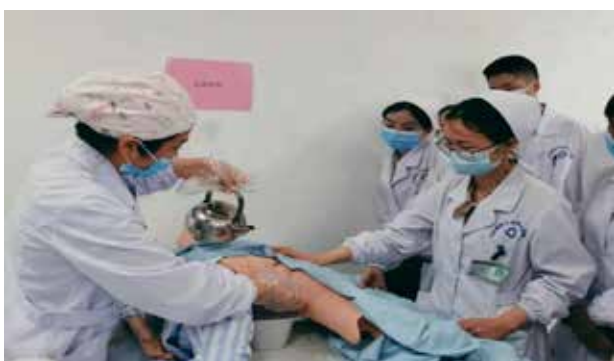
■ 会阴冲洗操作培训