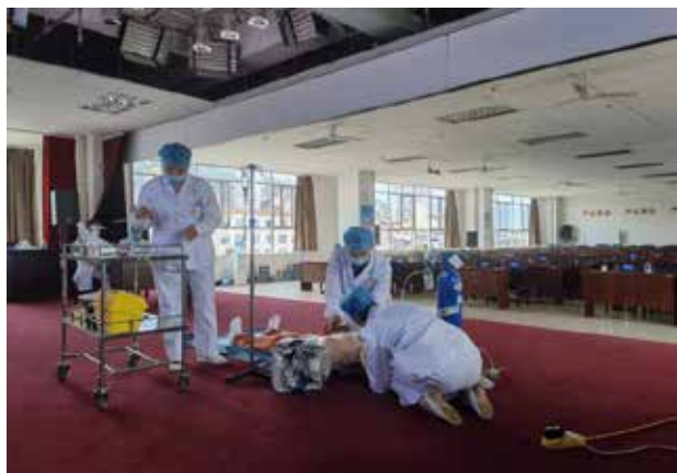
■ 外二科病区参赛队