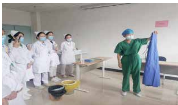
■ 穿脱隔离衣操作培训