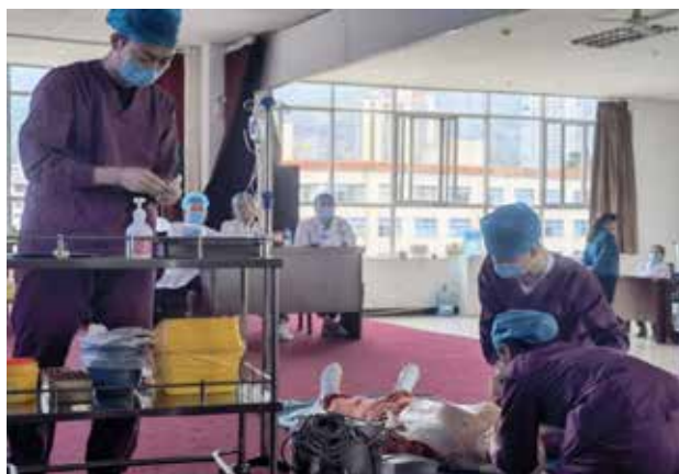
■ ICU 参赛队