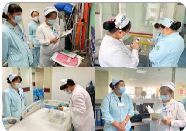
■ 病区安全管理检查

体现，是提高护理质量的重要基石，此次检查中重点对病人的饮食、晨晚间护理、床单元管理、住院患者的“三短、九洁”、健康宣教落实情况进行了检查；消毒隔离是控制医院感染的基础，重点对各病区各消毒液配置合格情况，仪器设备使用后的处理消毒