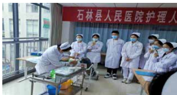
■ 氧气吸入疗法操作培训