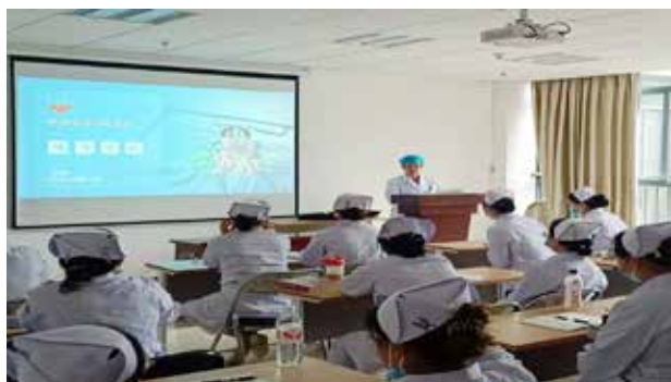
■ 护理文书书写规范讲解