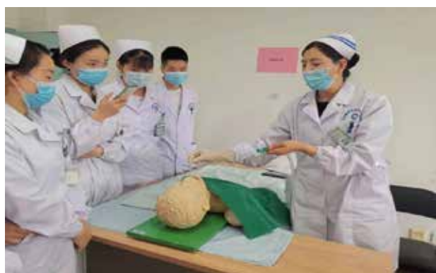
■ 吸痰护理技术培训