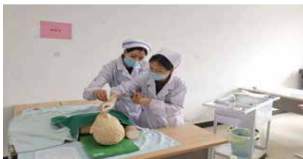
■ 示教老师指导吸痰护理操作护理工作 核心制度讲解