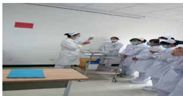
■ 皮试液的配制与皮内注射

理论培训结束，由本院护士长进行无菌技术、皮试液的配制与皮内注射、肌肉注射、氧气吸入疗法、静脉输液与给药查对、穿脱隔离衣、静脉血标本采集与静脉输血、男性、女性留置导尿术、口腔护理、吸痰护理、留置胃管等 13 项技能操作示教，老师们在示范操作的同时，也分享各自的工作经验，一一指导新招聘护士实操模拟训练，及时纠正训练中存在的问题；训练结束后对全体新招聘护士进行技能操作考试。