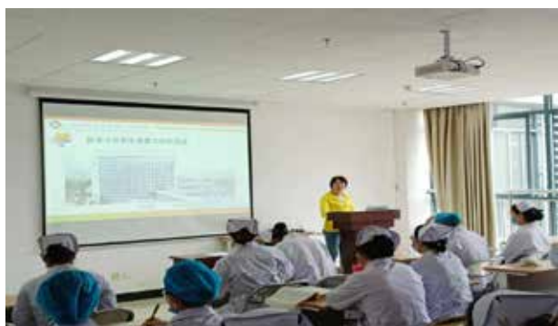
■ 医务人员职业暴露与防护措施讲解

此次岗前培训，新护士态度端正、主动认真，通过培训加深了新入职护士对护理规章制度、工作规范及职业素养的了解，规范了他们的操作技能，提高了他们对护理工作岗位的认识，加强了他们的护理安全防范意识及工作责任心。为今后的临床护理工作奠定了基础。