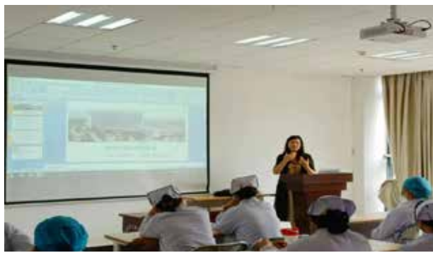
■ 护理工作核心制度讲解