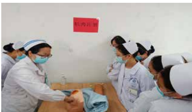
■ 肌肉注射操作培训