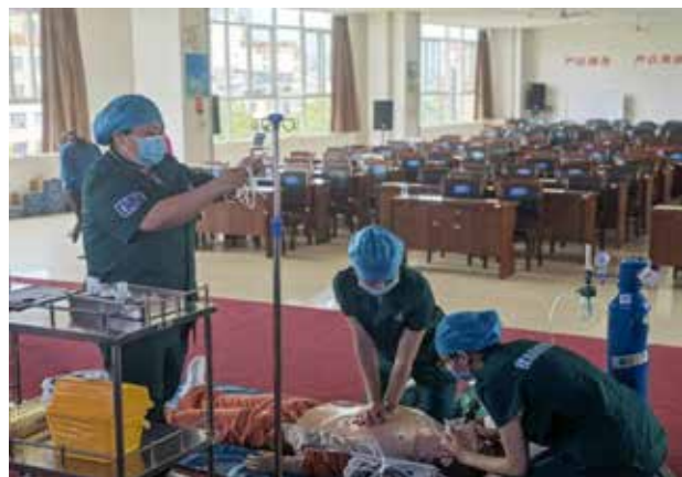
■ 120 急救中心参赛队